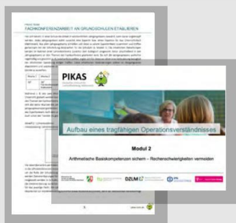
Material zur Fachberatungs- und Fachkonferenzarbeit