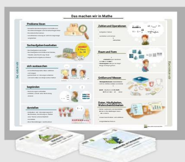
Material zum direkten Einsatz im Unterricht

Zu ausgewählten Themen wurden dafür bereits vielfältige Materialien konzipiert. Materialien zu weiteren Themen folgen.